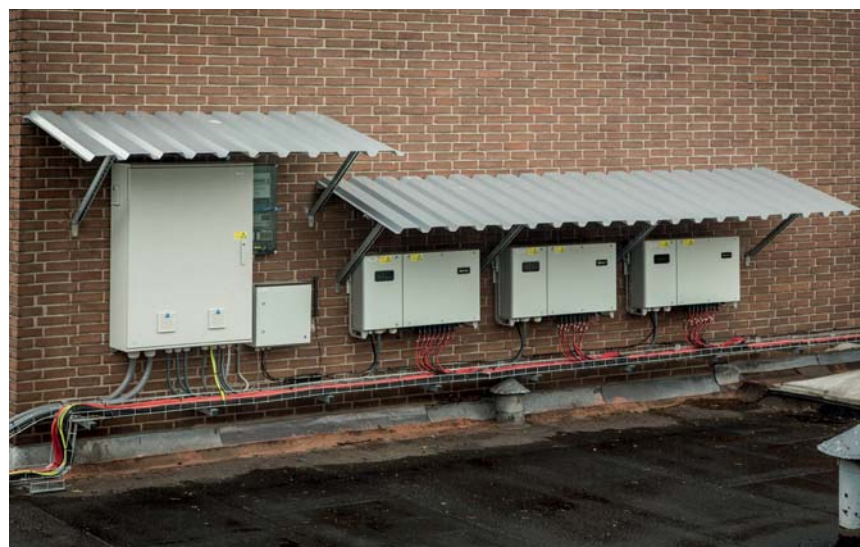
In maart lag het werk 16 uur stil voor de aanleg van van de installatie.