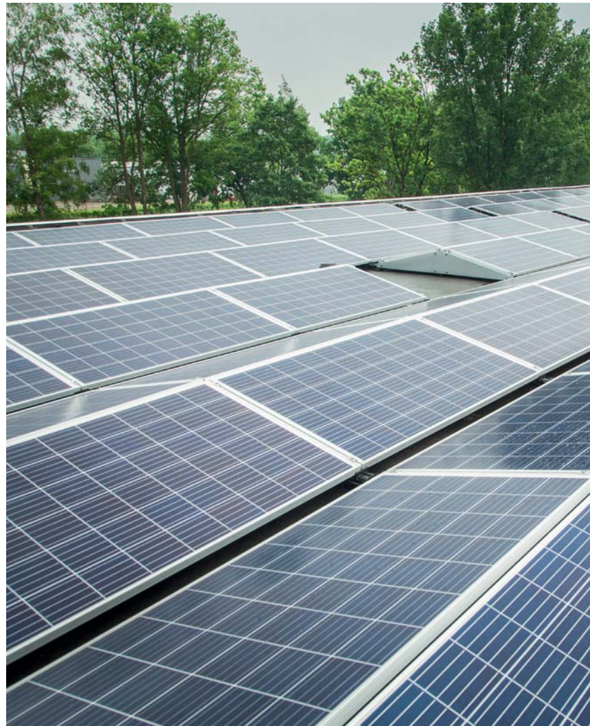
Bij Fuite liggen 902 zonnepanelen op het dak.

Een andere grote stap voor het bedrijf was het afstoten van het transport. Fuite: ‘We hadden 20 eigen vrachtwagens voor de deur en 30 man personeel om ons brood te distribueren. Voor ons geen onderdeel om mee te onderschei-