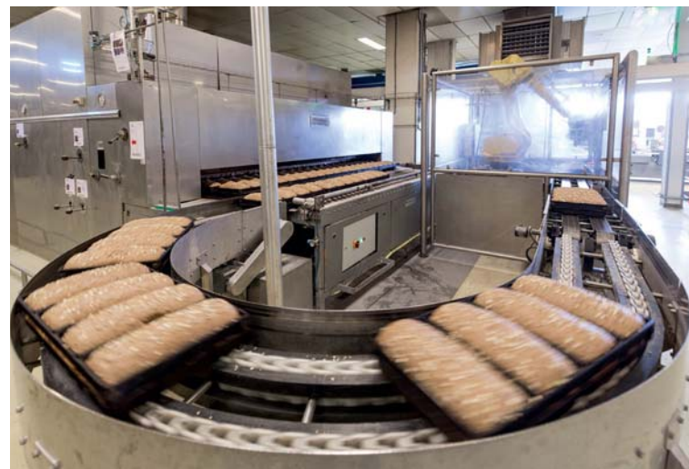
De bakkerij draait 24 uur per dag, op zonne-energie.

KiesZon met de beste oplossing. Ze waren niet de goedkoopste, maar dat wilden we ook niet. Duurzaamheid betekent voor ons niet alleen maar een paar zonnepanelen op het dak gooien, maar ook dat je goed omgaat met mensen en hun veiligheid. En wat ook hielp is dat KiesZon onderdeel is van Greenchoice, de grootste partij in Nederland als het gaat om zonnestroomprojecten. In december 2017 tekenden we het contract en voor 1 april 2018 moest de hele installatie draaien. Een uitdaging dus. KiesZon heeft bewezen